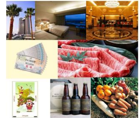
※商品はイメージです。