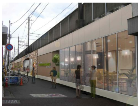
※外装はイメージです。

「私のお気に入りの風景」をコンセプトに、どこか懐かしい稲毛の街の風景や歴史が感じられるレンガ造りのアーチを5箇所のエントランスに施し、街の顔としての外観が大きく変わります。