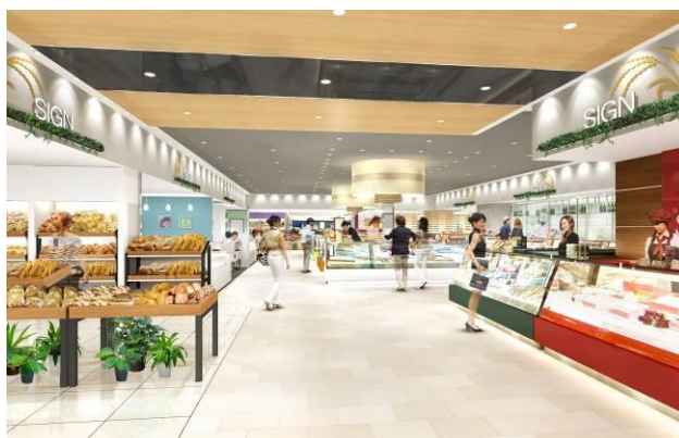
※内装写真はイメージです。