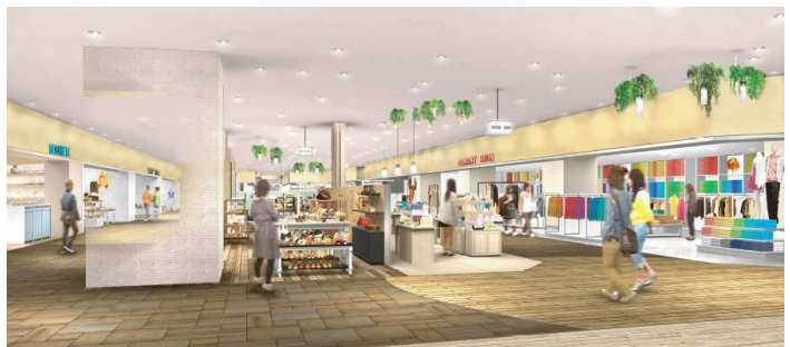
※内装写真はイメージです。