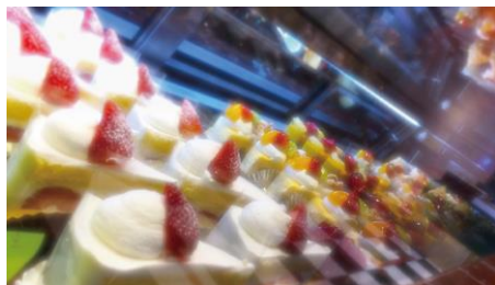
Artisan in CHIBA