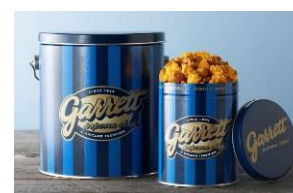
ギャレット ポップコーン ショップス