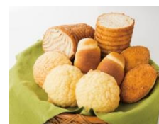
ピーターパン Jr 定番商品群