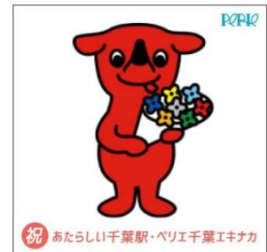
チーバくんフラッグ