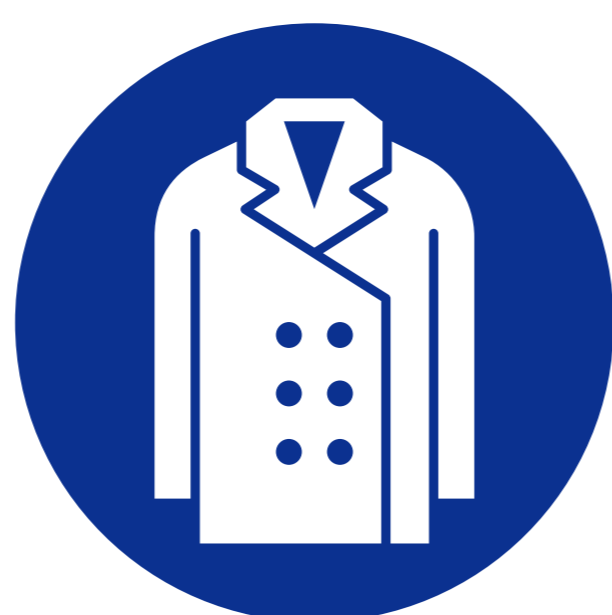
ジャケット・コート