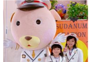
③「駅長犬」グリーティング