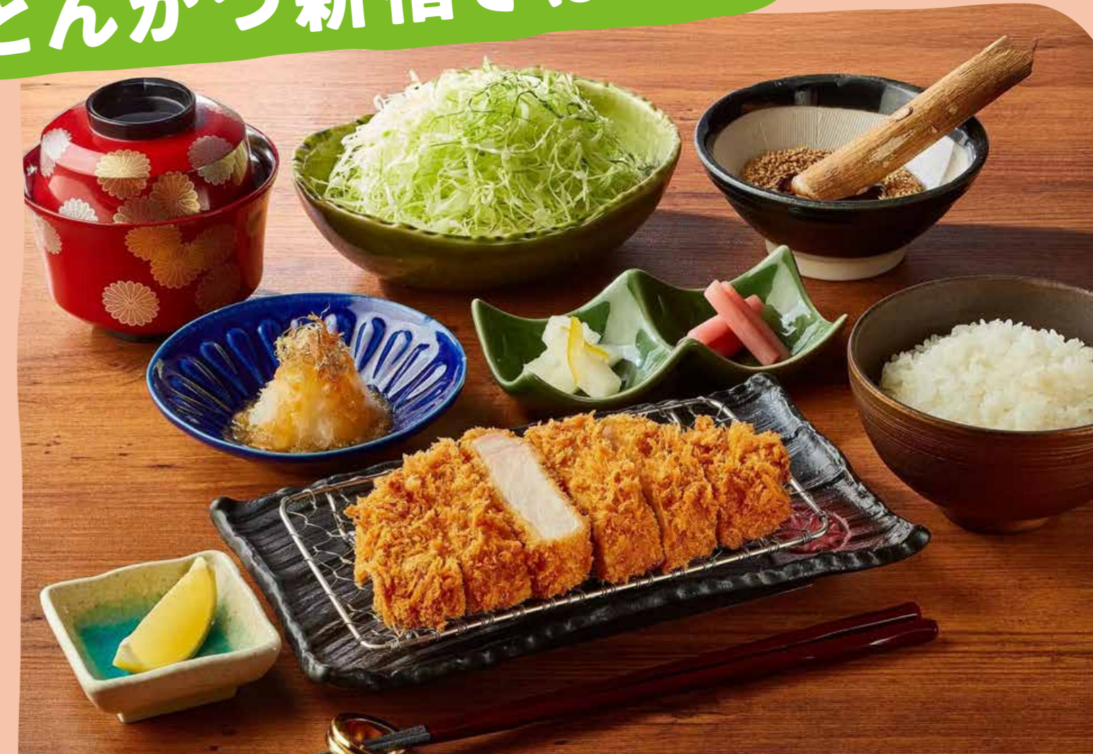
北海道熟成ごまてんローズかつ御膳 180g/2,618円(税込)