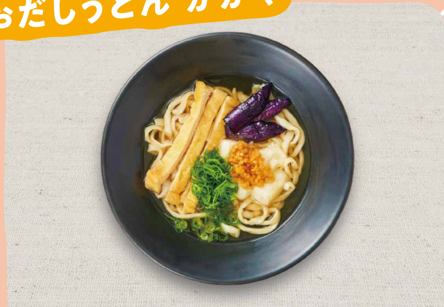
魚沼こがねもちと刻み生姜の きつねうどん 1,100円(税込)