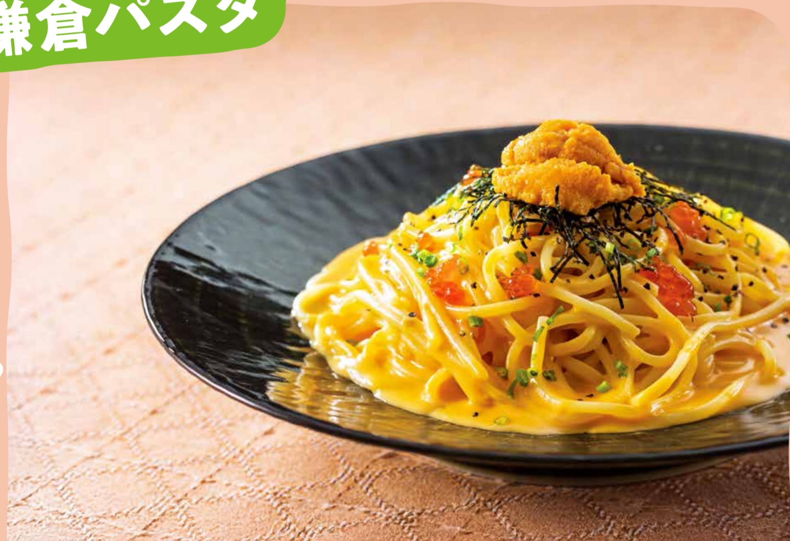
うにといくらの濃厚うにクリームパスタ 1,606円(税込)