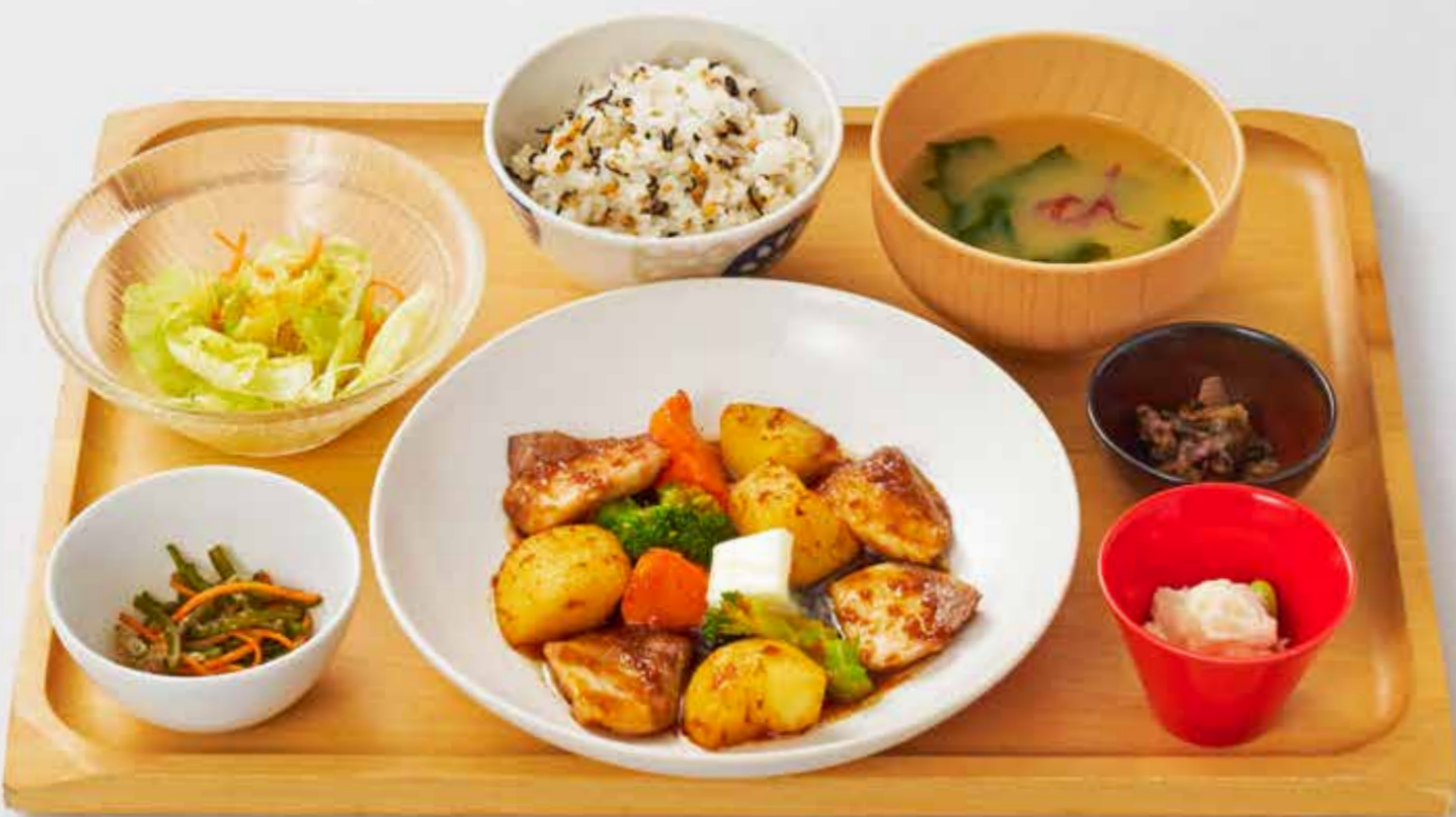
ブリジャガのバター醤油定食 1,580円(税込)