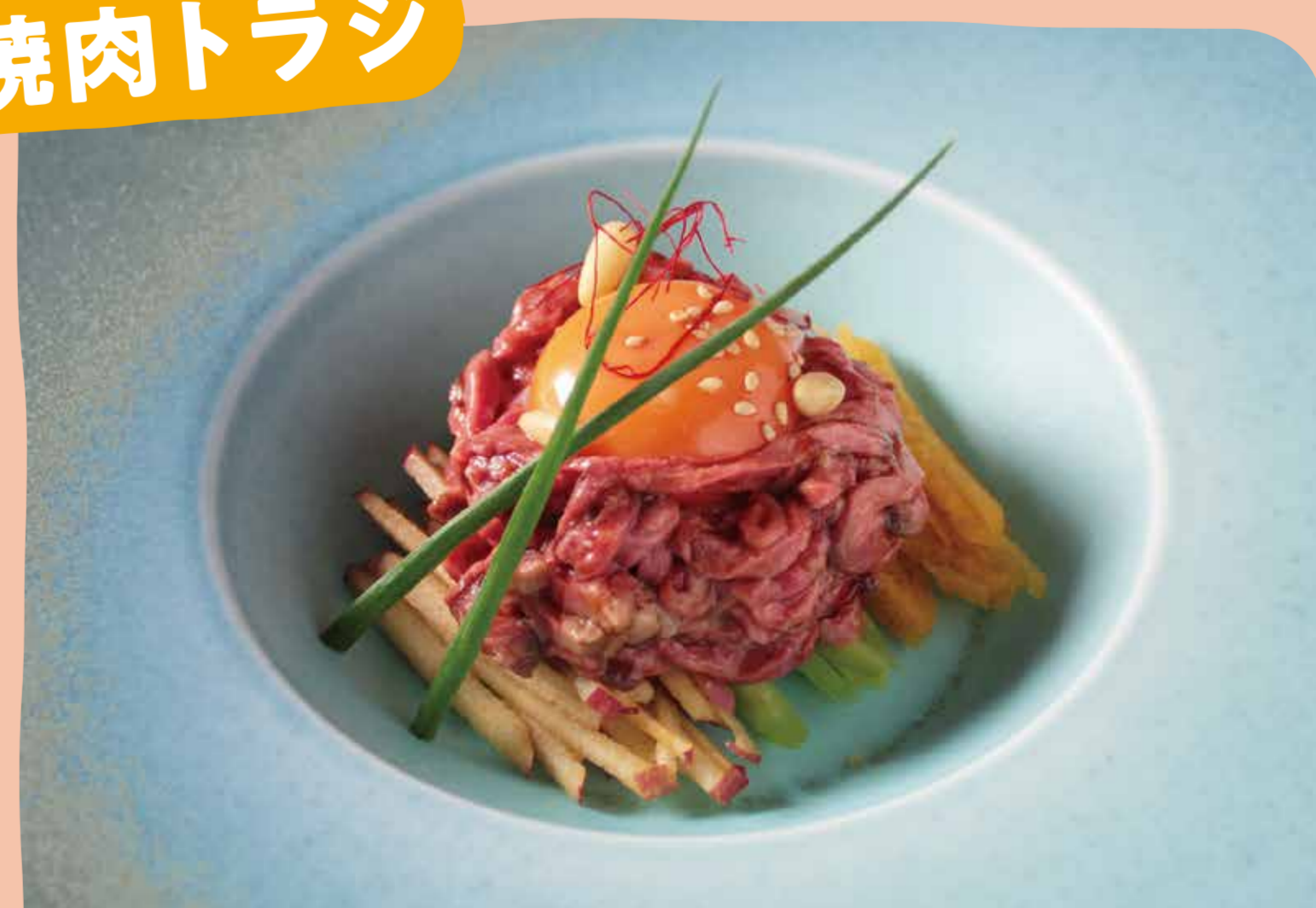
極みユッケ -真空低温調理- 1,800円(税込)