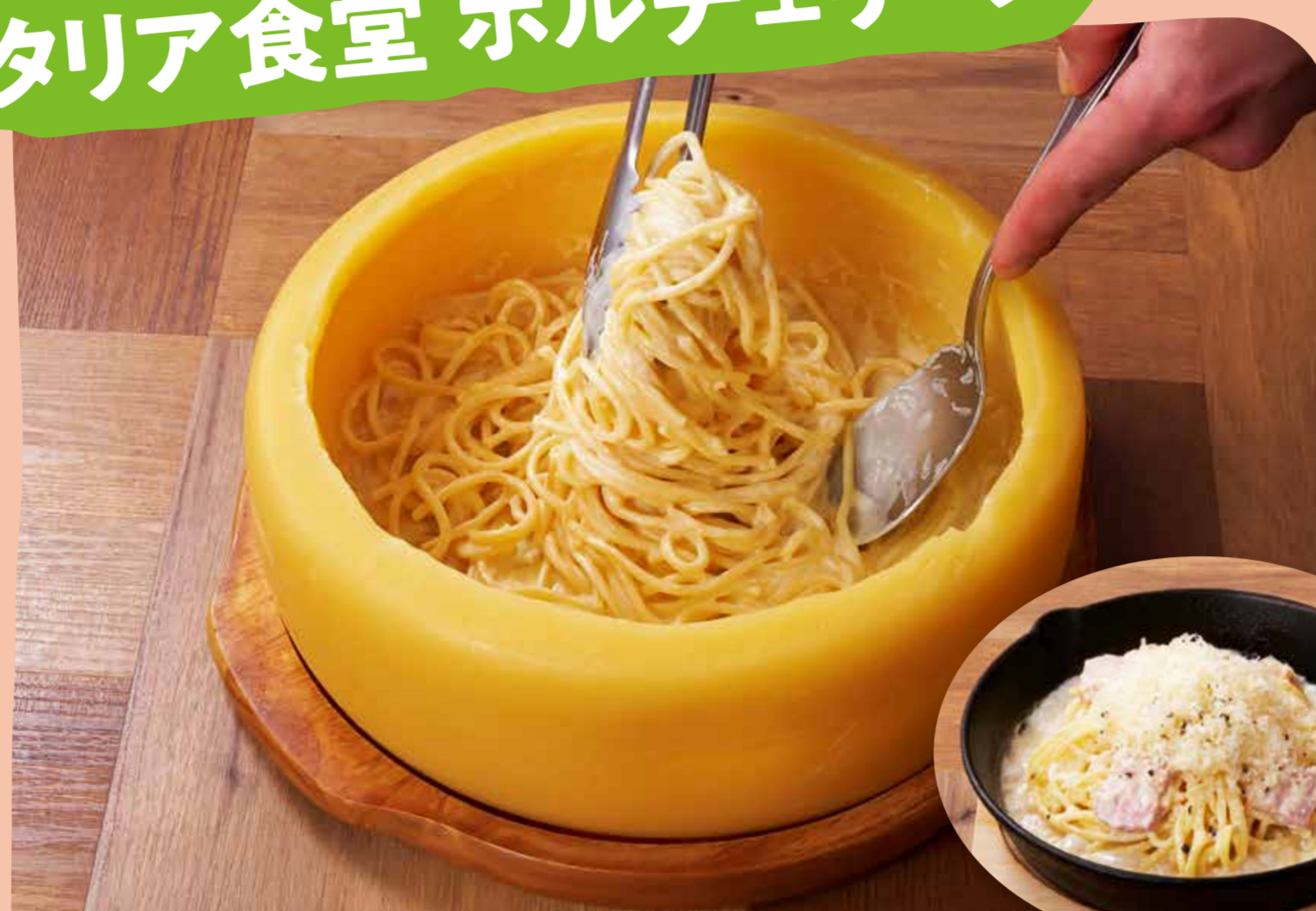
チーズの器で作るカルボナーラ 1,749円(税込)