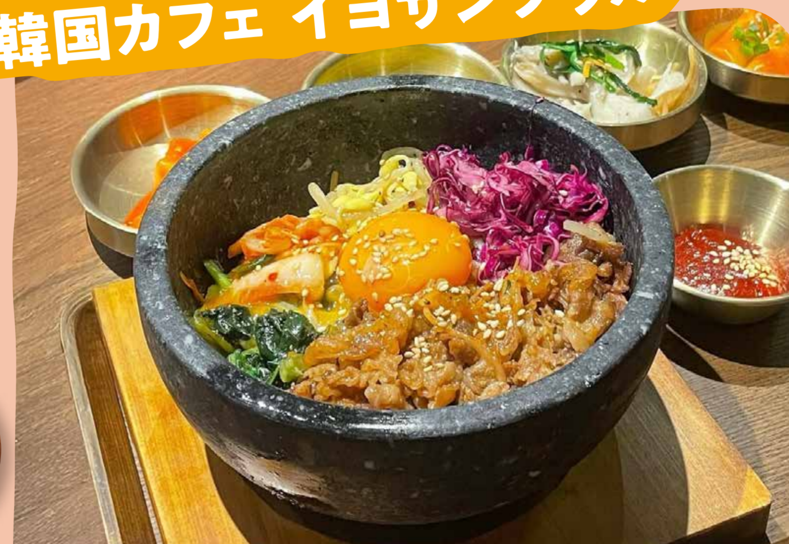
石焼ビビンバ 1,480円(税込)