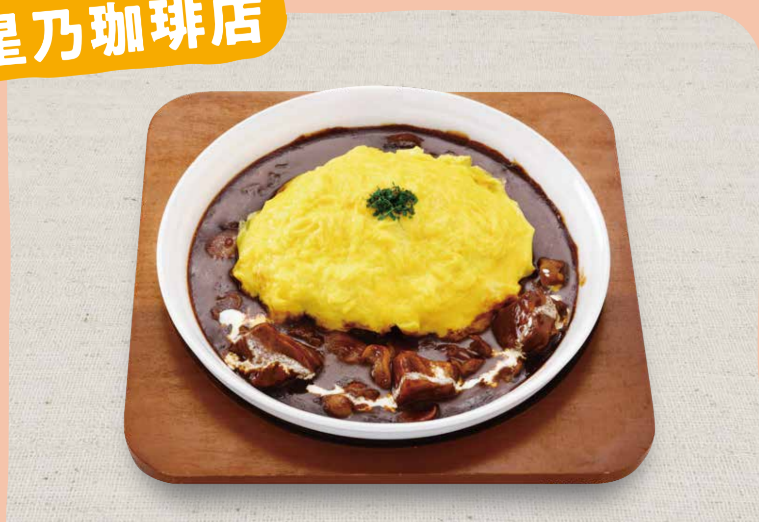
ビーフシチューオムライスドリア 930円(税込)/ドリンク付き 1,410円(税込)