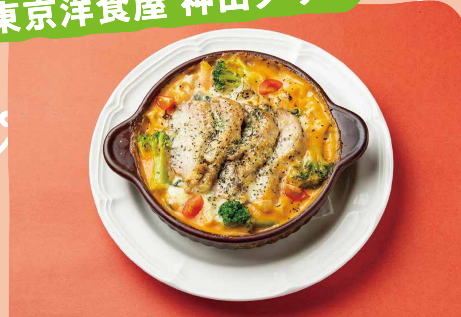
大山どりとう野菜のトマトクリーム ペンネグラタン 1,480円(税込)