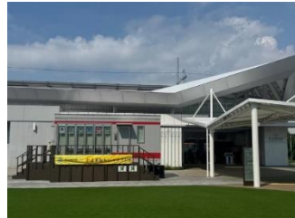
鉄道運転体験ハウス とよすなトレイン P318