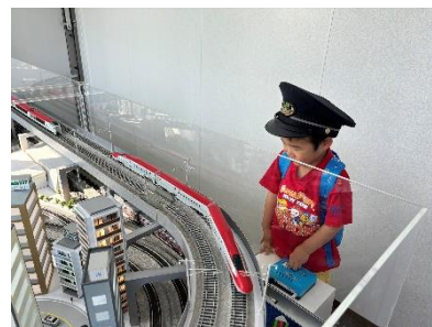
鉄道ジオラマ体験