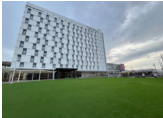
とよすなうみかぜ広場

「X」とよすなトレイン P318 公式アカウント https://x.com/toyosunatrailer?s=20