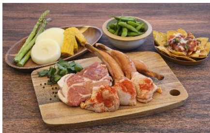
バーベキューメニュー イメージ