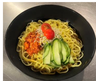
夏季限定 冷麺 イメージ