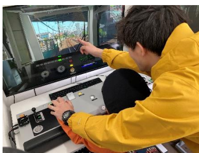
JR東日本トレインシミュレータ体験