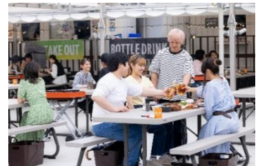
幕張豊砂BBQ ビアガーデン