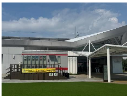
とよすなトレイン P318