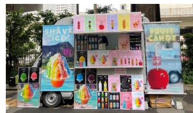
Food truck 81