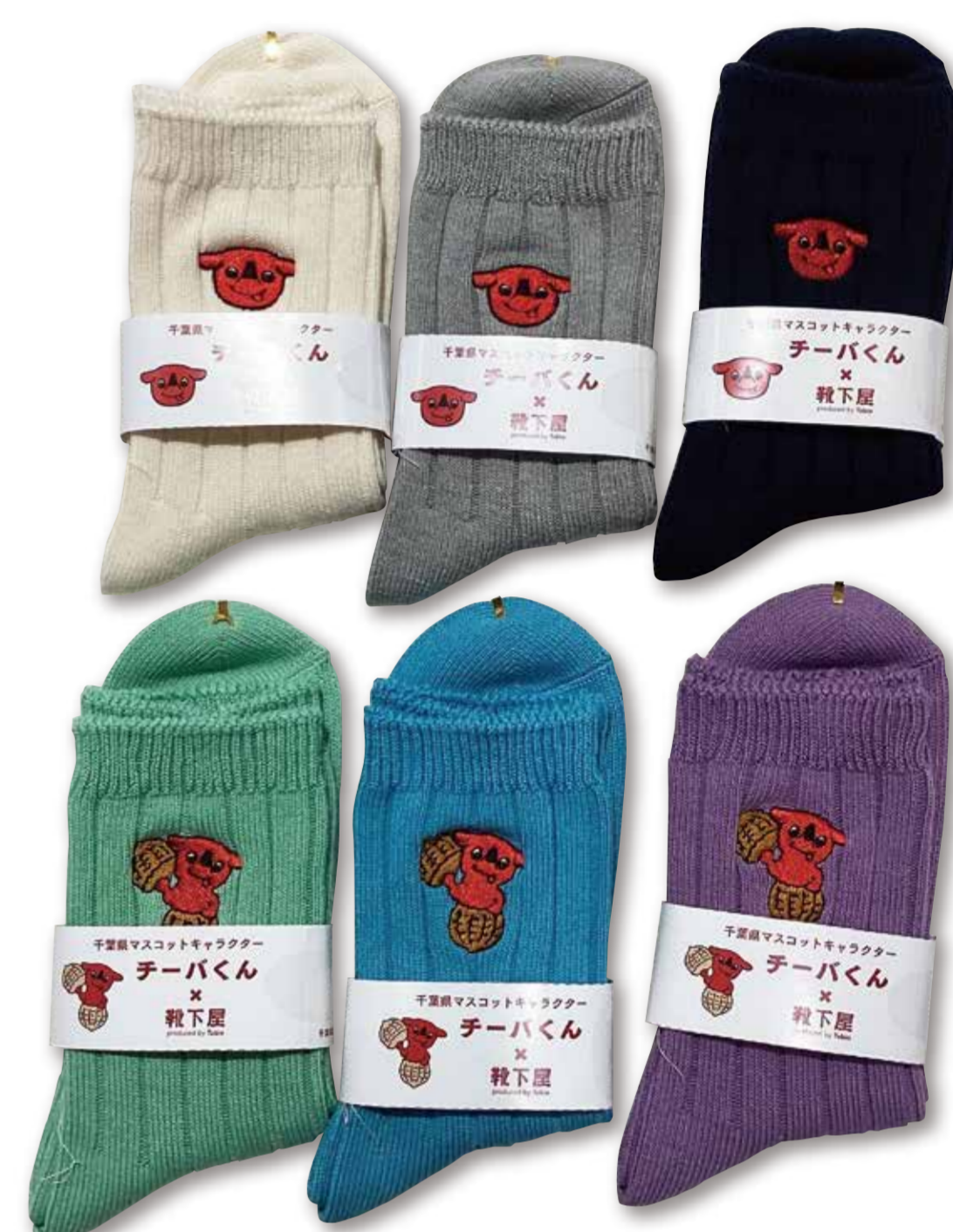
千葉県 PR マスコットキャラクターチーバくんの刺繍ソックス

6月15日(月)は県民の日！千葉にゆかりのあるショップが集結。千葉県産のみずみずしい旬な青果や海産物をはじめ美味しいが大集合！また、チーバくんの刺繍ソックスなど気になるアイテムも目白押し。