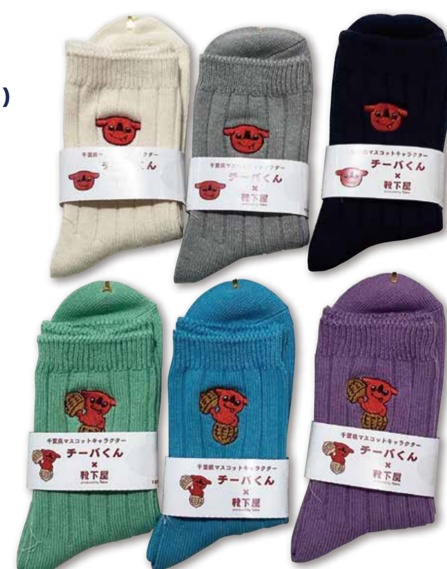
千葉県 PR マスコットキャラクター チーバくんの刺繍ソックス

6月15日(月)は県民の日！千葉にゆかりのあるショップが集結。千葉県産のみずみずしい旬な青果や海産物をはじめ美味しいが大集合！また、チーバくんの刺繍ソックスなど気になるアイテムも目白押し。